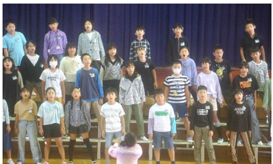
「4年生」 輪唱・二部合唱さすが！