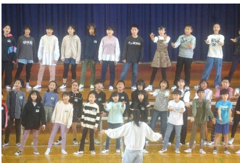
「5年生」 気持ちのこもった歌声