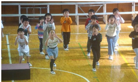
「1年生」 ヤッホー！元気よく！

8日(水)、音楽集会を行いました。久し振りの全校児童・保護者が一堂に会しての音楽集会、どの学年も日頃の音楽学習の成果を十分に発揮した素晴らしい発表を披露してくれました。同時に行った金管部の引退コンサートも、大変盛り上がりました。当日は平日にも関わらず、多くの保護者の皆様にお越しいただきました。この場を借りてお礼を申し上げます。ありがとうございました。