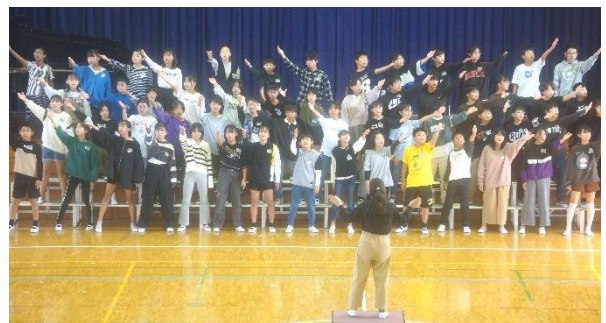
「6年生」 最高学年にふさわしい合唱