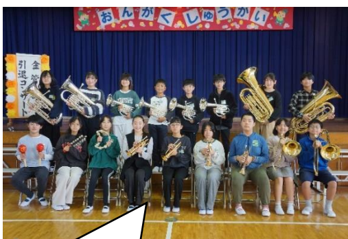
金管部の6年生のみなさん 2年間、お疲れさまでした！