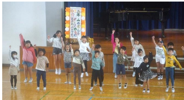
「2年生」 のねずみチュー！かわいい！