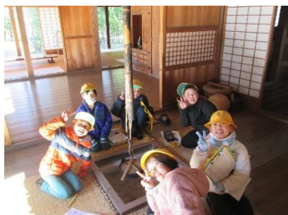
囲炉裏っていいですね!