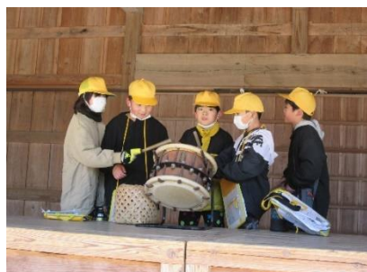
太鼓も今はめずらしい?!

3年生にとっては、 今年度初めてのお弁当持ちでの1日校外学習 。とても寒い日ではありましたが、友達と見学したり、お弁当を食べたり、話をしたりと 1日楽しく過ごすことができました。 保護者の皆様におかれましては、朝早くからのお弁当の準備等、ご協力ありがとうございました。