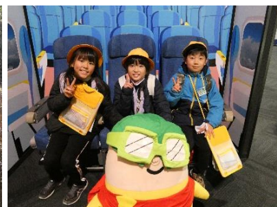
本物にも乗ってみたいな!