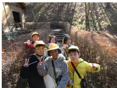
班で協力できました!