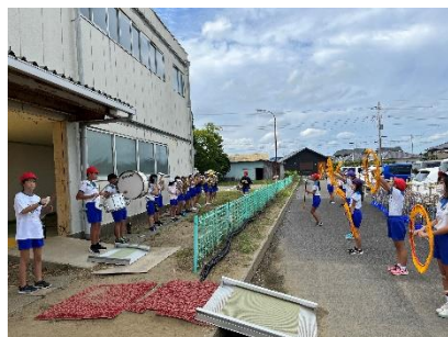
↑昼休みのマーチング練習