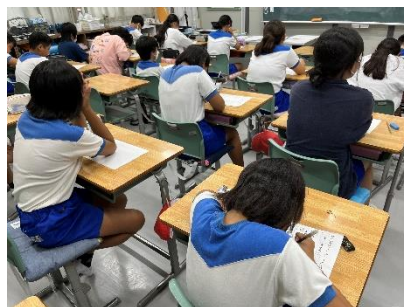
↑おまけ(全校テストも頑張っています！)