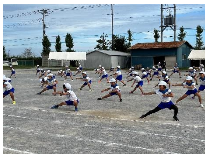
↑中学年ソーラン練習