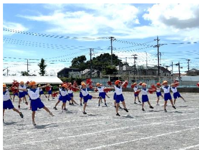
↑低学年ダンス練習