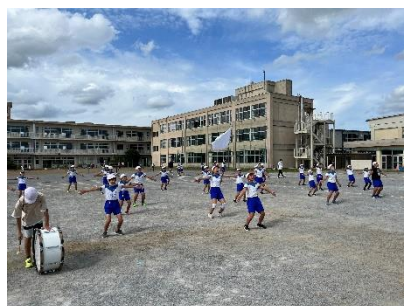
↑昼休みの応援団練習