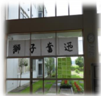
美術部が制作したスローガン