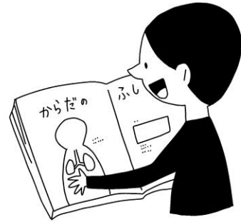
体のことについて、 知りたいことがある