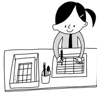
けがや病気の手当を受けたら、 記録表に記入しましょう。