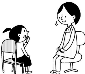
けがをした理由や体の具合を、保健室の先生にはっきりと伝えましょう。