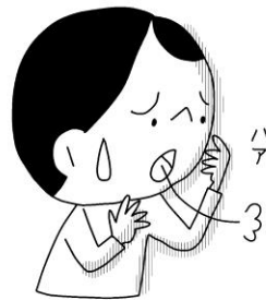
なやんでいることがある