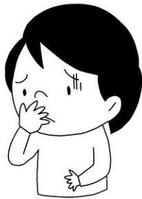
気分が悪くなった はきそう