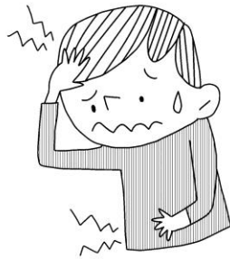
痛いところがある (頭やおなかなど)