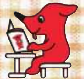
千葉県マスコットキャラクター「チーバくん」