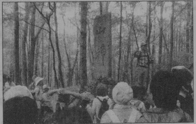
▲ ちびっこ広場親子たかはら山滝めぐりの様子