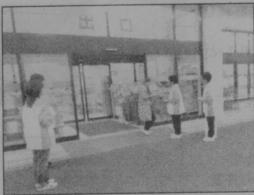
▲ マイパックキャンペーン活動の様子