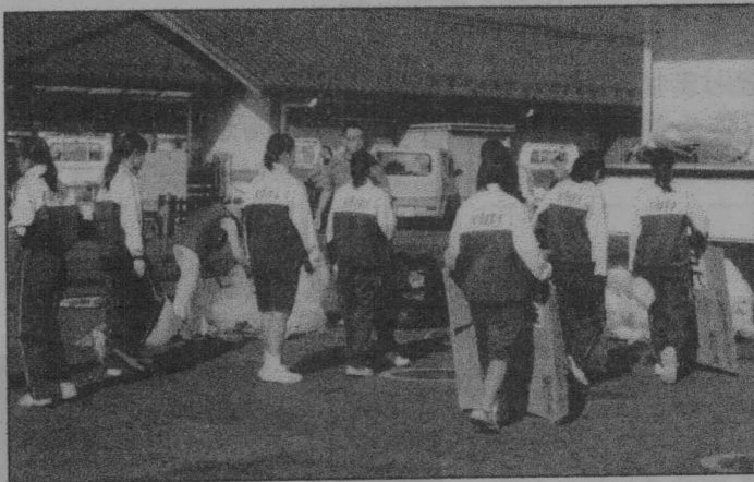
▲ 花火大会翌日の清掃ボランティアの様子