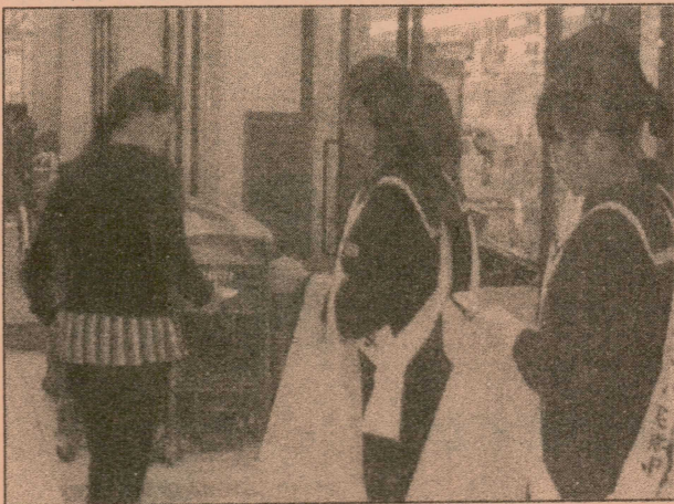
▲ マイバックキャンペーン活動の様子