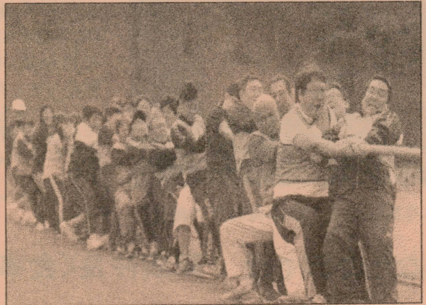
▲ 市民体育祭の様子