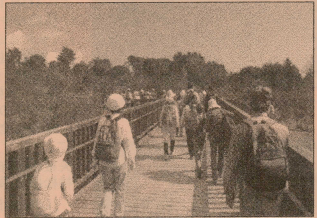
▲ ちびっこ広場親子たかはら山ハイキングの様子