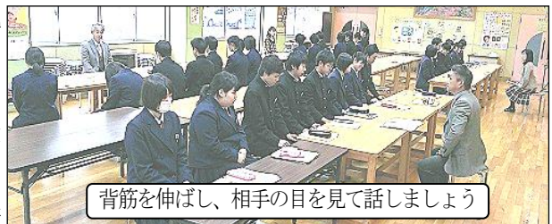
背筋を伸ばし、相手の目を見て話しましょう

今月からは3年生に対し「話し言葉」による表現力の指導を開始。第1回目となるこの日は、200字程度の物語を読んで感想や主題を発表する練習をしました。初回と言うことで質問に対する答え方の基本を、4名の教師が各々のグループで指導。生徒の真剣な表情が印象的でした。