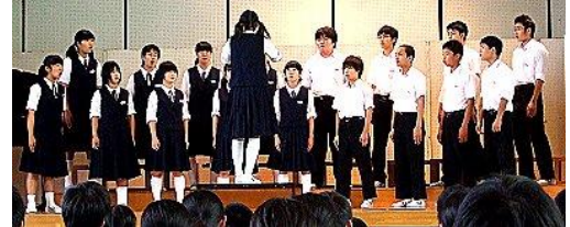
最優秀賞に輝いた3年2組「あなたへ」