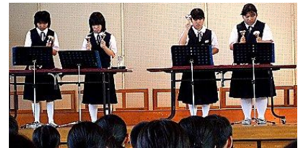
創作部 ハンドベル演奏