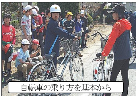
自転車の乗り方を基本から