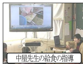
中屋先生の給食の指導