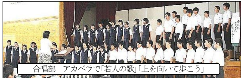
合唱部 アカペラで「若人の歌」「上を向いて歩こう」