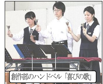
創作部のハンドベル「喜びの歌」