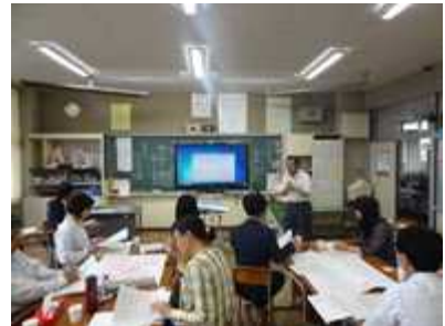
県教委学力向上専門員や市教委指導主事の訪問を要請し、御指導をいただいています。