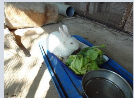
【元気な頃の「ゆき」 (令和3年5月3日)】

これまで一生懸命「ゆき」のお世話をしてくれた、環境委員の皆さん、それ以外の児童も「ゆき」と仲良くしてくれたことに、お礼を言いたいと思います。本当に、ありがとうございました。