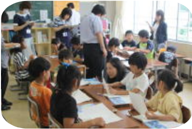
【3年2組提案授業の様子】