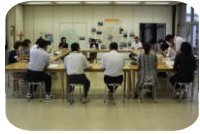
【全体研修でまとめ】