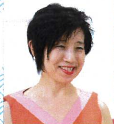
金沢 21 世紀美術館 館長 長谷川祐子氏

金沢 21 世紀美術館 館長、東京藝術大学大学院国際芸術創造研究科 教授 キュレーター、美術批評。京都大学法学部卒業。東京藝術大学大学院美術研究科修士課程修了。水戸芸術館学芸員、ホイットニー美術館客員キュレーター、世田谷美術館学芸員、金沢 21 世紀美術館学芸課長及び芸術監督、東京都現代美術館チーフキュレーター及び参事を経て、2021年4月から金沢 21 世紀美術館館長。文化庁長官表彰(2020)。主な企画展・国際展に、第7回イスタンブール・ビエンナーレ「エゴファーガル」(2001年)、第4回上海ビエンナーレ(2002年)、第29回サン・パウロ・ビエンナーレ(2010年)、第11回シャルジャ・ビエンナーレ「re-emerge, toward a new cultural cartography (リ・イマージ: 新たな文化地図をもとめて)」(2013年)、第7回モスクワ・ビエンナーレ「Clouds ⇄ Forest」(2017年)、第2回タイランド・ビエンナーレ(2021年)など。主な著書に、『キュレーション 知と感性を揺さぶる力』、『なぜ? から始める現代アート』、『破壊しに、と彼女たちは言う: 柔らかに境界を横断する女性アーティストたち』、『ジャパノラマ-1970年以降の日本の現代アート』、『新しいエコロジーとアート「まごつき期」としての人新世」など。