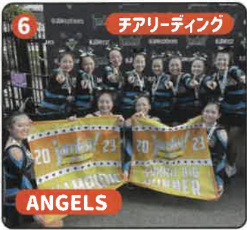
6 チアリーディング