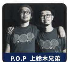
P.O.P 上鈴木兄弟 MCで参加！

【出演者・団体】 宇都宮中央高校 佐野日大中等教育学校・高校 DJ KANTA/コネクトダンススタジオ 幸福の科学学園中学校・高校 / ANGELS Produced by DAIZZY'S 凜空 國學院大学栃木高校