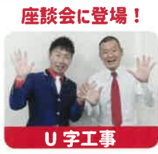
座談会に登場！ U字工事

高校生から29歳までの若者が、「観光・文化」「子育てしやすい環境づくり」など7つのテーマに分かれ、理想とするとちぎの将来像を描き、発表します。