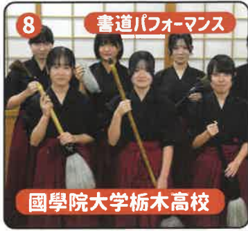
8 書道パフォーマンス