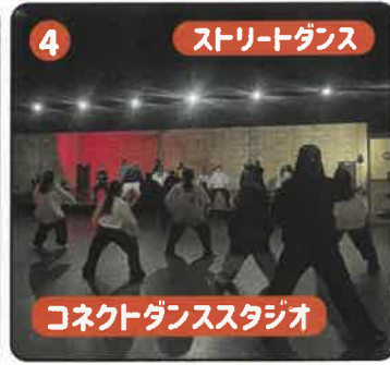
4 ストリートダンス