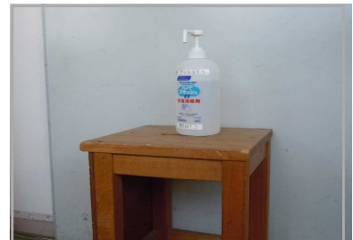
<教室前の消毒アルコール>