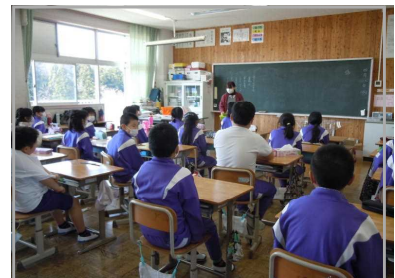
<換気をしながらの学習>