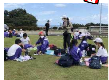
<太平洋を望みながら>

「めっちゃ楽しかった」「また行きたあ〜い」帰校の式のあと、ある女の子が話しかけてきました。