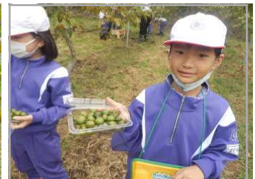
<こんなに収穫しました。>

総合的な学習は地域を知ることそのもの も目的の一つです。子どもたちに、「ふるさと玉川」を教え、心に、地域に誇りを持つ種を蒔くことも学校の重要な役目です。今後とも、生活科・総合的な学習を柱とした地域学習を推進していきます。