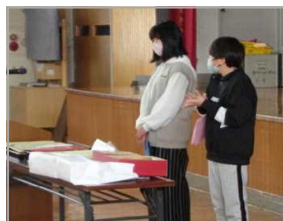
<とても立派な発表でした>