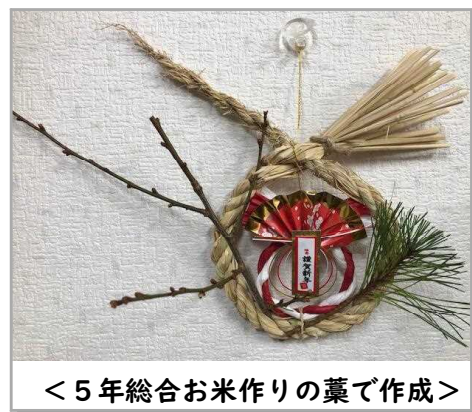
＜5年総合お米作りの藁で作成＞