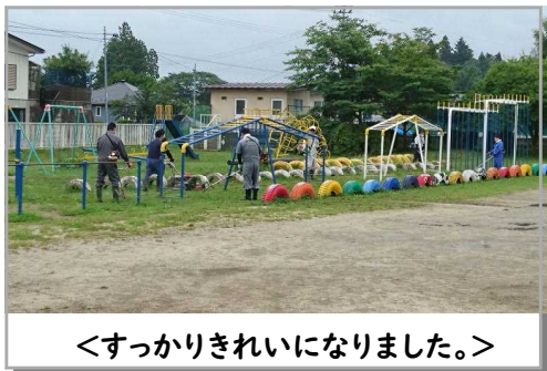
<すっきりきれいになりました。>

7月11日(土)早朝より、PTA三役及び施設委員、本校職員による奉仕作業が実施されました。感染症予防対策のため、これまで活動を制限していたPTA活動の初陣を飾ったのです。