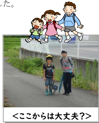
<ここからは大丈夫?!>