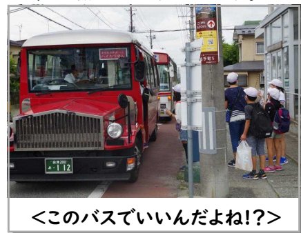
<このバスでいいんだよね!?!>