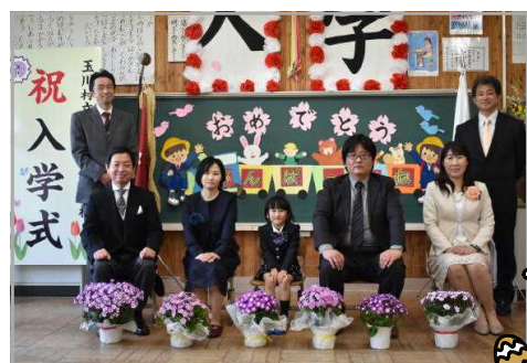
＜参加できなかったお子さんも＞