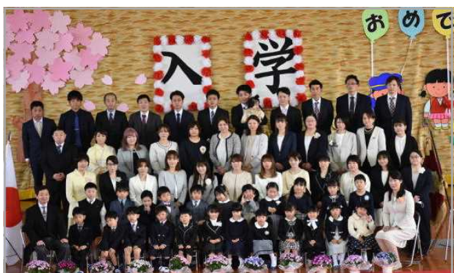
＜新1年生が春を連れてやってきた＞

210名が、本校の教育目標「 自ら取り組み、心豊かでたくましい児童 」に少しでも近づくことができるよう、一丸となって努めます。