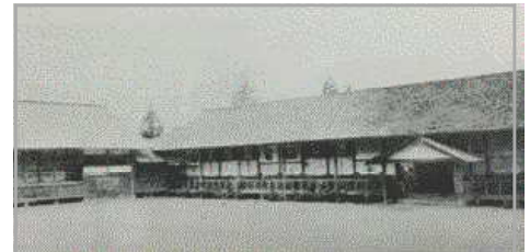
<小高小学校(現玉一小)>