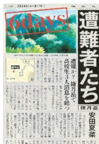
⑦『6 days 遭難者たち』 安田夏菜／著