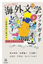
⑬『はじめて読む！ 海外文学ブックガイド』 越前敏弥／著 他

人気翻訳者おすすめの海外文学ガイドブックです。簡単に読めるものから、古典文学まで、様々なジャンルを面白く紹介しています。海外小説を読んだことがない人も、ぜひ参考にしてください。