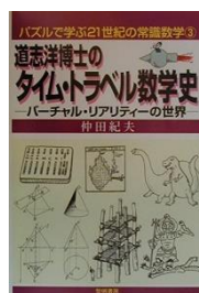
『道志洋博士のタイム・トラ ベル数学史—バーチャル・ リアリティーの世界』 仲田紀夫/著