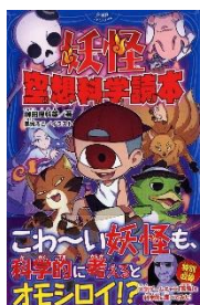
『妖怪 空想科学読本』 柳田理科雄/著