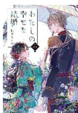
『私の幸せな結婚 6』 顎木 あくみ/著

図書室の本は、鶴牧中学校の財産です。借りた本は必ず返してください。 また、紛失した場合や、破損、水濡れ等があった場合は、いつでも相談に来てください。