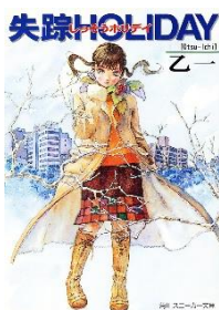
『失踪 HOLIDAY』 乙一/著