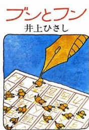
『ブンとファン』 井上ひさし/著