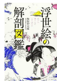
『浮世絵の解剖図鑑 —江戸の暮らしがよく分 かる—』 牧野健太郎/著