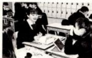
現代文の授業で、課題について話し合いを進めながら学ぶ生徒たち。右は東京府立高校の文化祭で開かれた読解力調査の会場。