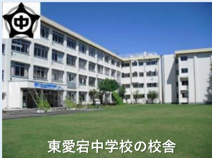
東愛宕中学校の校舎