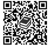
青陵中学校図書館 の本を探す

長い夏休みもあっという間に終わり、2学期が始まりました。お休みモードから学校モードへのギアチェンジはできていますか？「読書の夏」を過ごした司書は、みなさんに紹介したい本がたくさんあります！新刊もたっぷり入ったので、ぜひ図書館にきてくださいね。