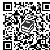
青陵中学校図書館の本を探す