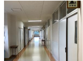
校舎改修後のピカピカの廊下→

2学期がスタートし2週間余りが過ぎました。1年生の皆さんも、校舎改修後の新しい教室での過ごし方や、2学期の生活リズムに慣れてきた様子で、感染対策をとりながら、それぞれのペースで楽しそうに過ごしています。また、新しくなった校舎をきれいな状態で保とうとする気持ちをもっている生徒も多く、白い壁についた足跡を雑巾で拭きとってくれています。1人1人が校舎を大切にすることを生活していきましょう。