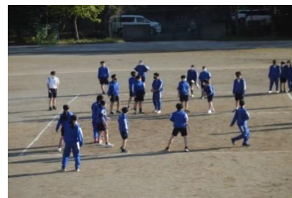
1・2年ブラッシング指導