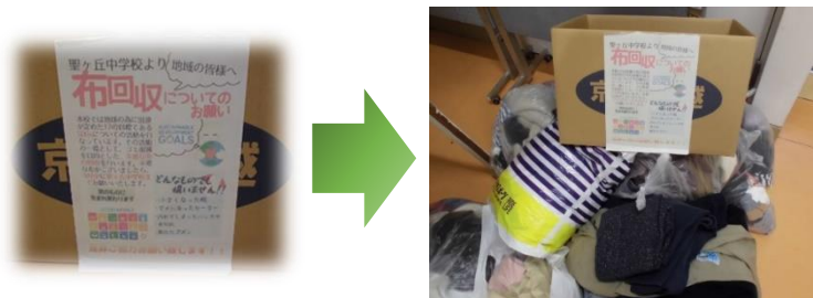
2組集団による古着の回収