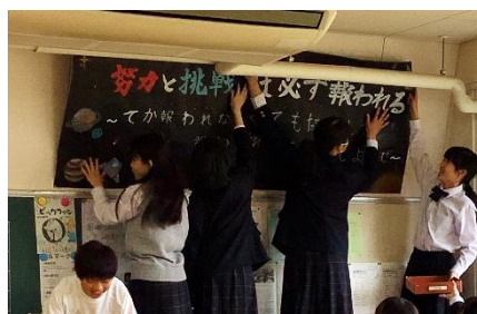
< 学級目標の立案・掲示に取り組む1年4組 >

その後、「目標」と「目的」をセットで考える癖がつきました。すぐにははっきりした答えがでなくても、考える過程で気付くことがあり、それを繰り返すことで考えが深まっていくことがわかりました。