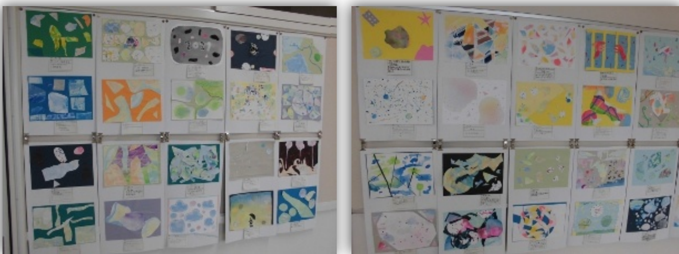
<美術・躍動感を捉えて>