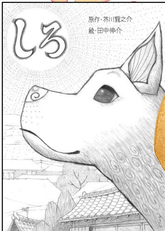
『白』芥川 龍之介/著 みらいパブリッシング

芥川 龍之介の名作の童話『白』。毛の色が白と黒の仲良しの犬がいた。しかし、黒は、犬殺しに殺されてしまう。それを見ていた白は、怖さから見て見ぬふりをした。すると、白の毛の色が・・・。 “見て見ぬふり”は「罪」になるのか?難しい問題に迫ります!