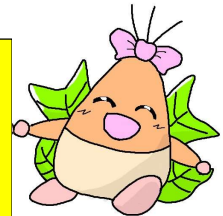
▲10周年記念キャラクター ゆり(右) ぐり(左)