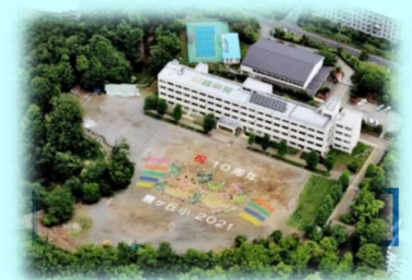
開校10周年記念航空写真