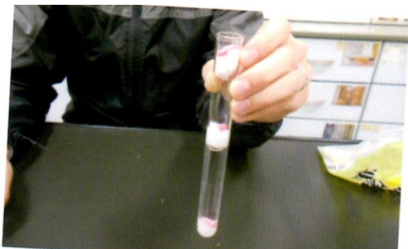
⑤再びわたを入れる ⑥三つ目の種を入れる