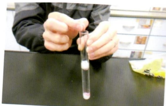
④二つ目の種を入れる