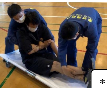
*実際に担架で搬送

救命救急法やAEDの使い方、搬送方法、アレルギー症状への緊急対応（シミュレーション研修）などを実施していますよ。