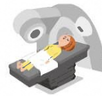
病気で放射線治療を受けたとき