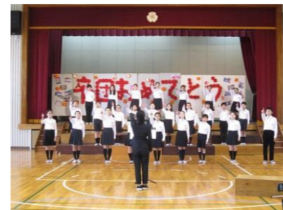
さくらコンサート