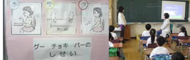
ソーシャルスキルトレーニング「かがやきタイム」

学習規律・生活規律の確立 特別支援教室の指導を活用したソーシャルスキルトレーニング 教師と児童、児童相互の信頼関係の構築 いじめを生まない心の育成 防災意識の向上 特別支援学級との連携によるノーマライゼーションの推進