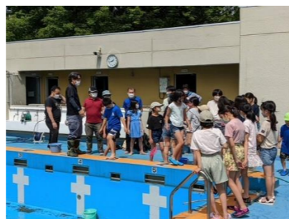
おやじの会によるめだかすくい