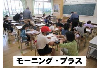
モーニング・プラス

授業改善推進プランに沿った指導による基礎学力の定着 全学年での算数習熟度別指導 補習教室「モーニング・プラス」 全校での自主学習の取り組みによる家庭との学びの連携 道徳授業の充実による人間性の陶冶 交換授業による複数教員の指導を通した多様な価値観の育成