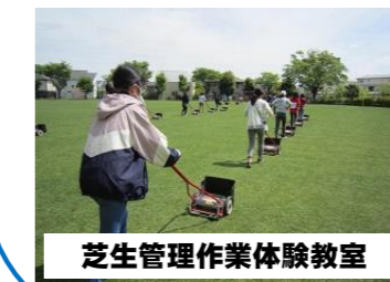
芝生管理作業体験教室