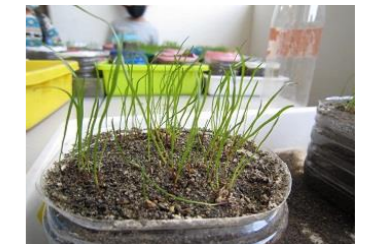
マイ芝生を育てる