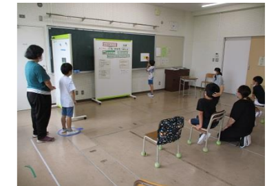
特別支援教室「わかば」