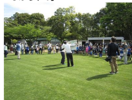
Gネットによる芝生管理作業