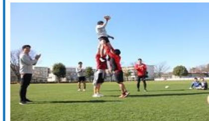
キャノンイーグルスとの交流授業

緑の芝生の上で思い切り体を動かすことでの体力向上 はだしの推奨 教室の窓から見る緑の芝生と青空による心の安定