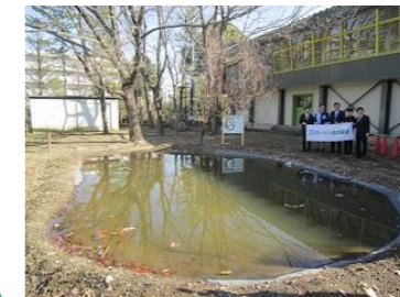
ビオトープ改修完成式典

ビオトープや果樹のなる樹木、広大な学校農園の活用 特別支援教室・特別支援学級の指導方法を活かした個に応じた指導 スクールカウンセラーとの随時面談と毎月のいじめアンケート