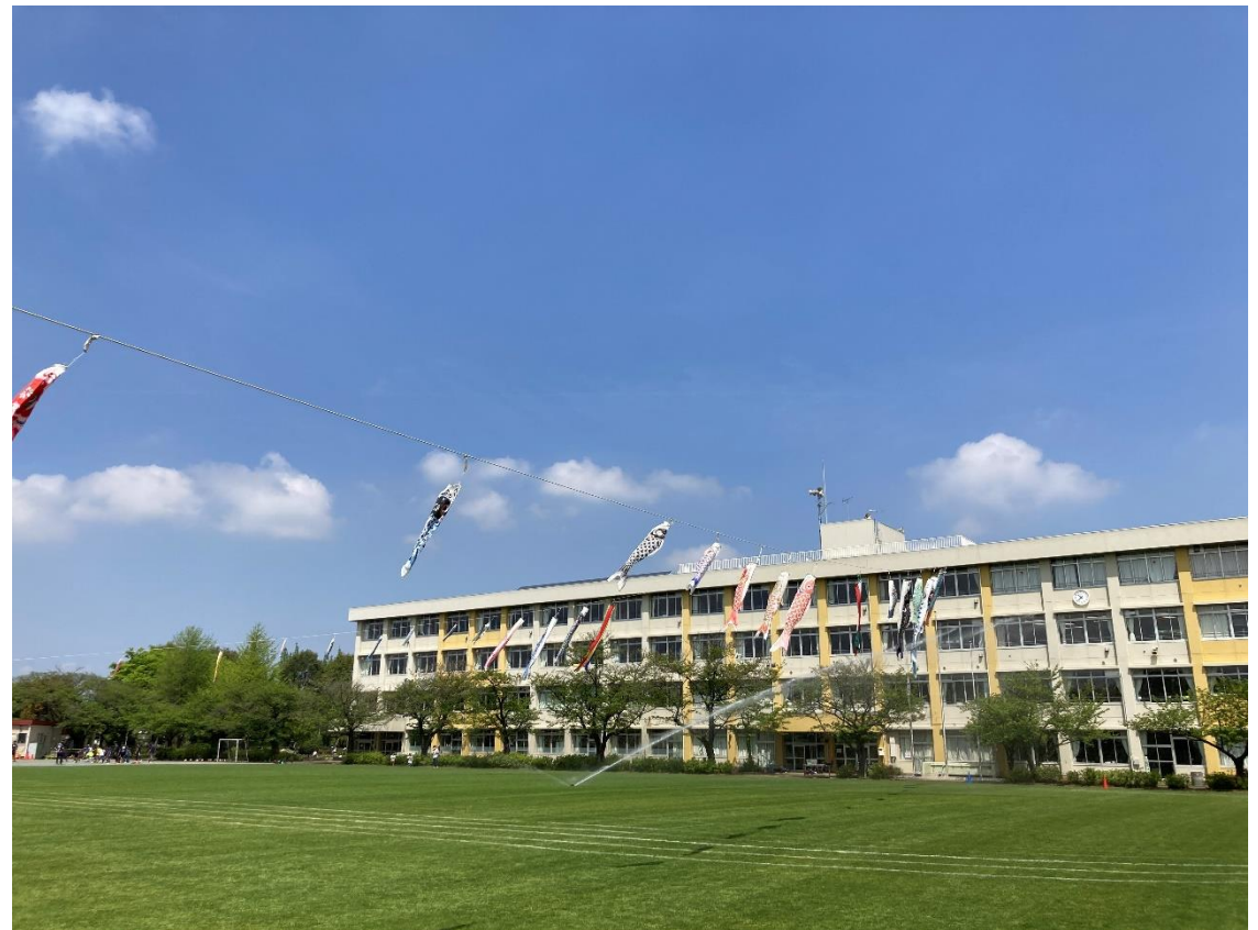
南鶴牧小の5月 校庭の鯉のぼり