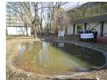
ビオトープ改修完成式典

ビオトープや果樹のなる樹木、広大な学校農園の活用 特別支援教室・特別支援学級の指導方法を活かした個に応じた指導 スクールカウンセラーとの随時面談と毎月のいじめアンケート