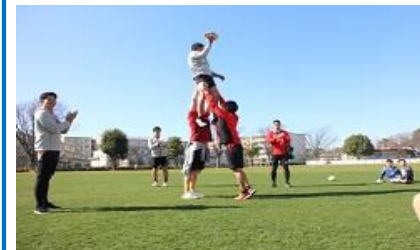
キヤノンイーグルスとの交流授業

緑の芝生の上で思い切り体を動かすことでの体力向上 はだしの推奨 教室の窓から見る緑の芝生と青空による心の安定