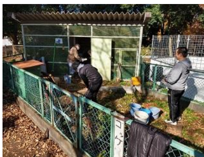
おやじの会による飼育小屋の修理