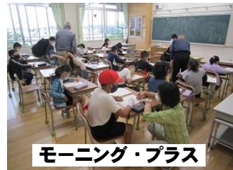
モーニング・プラス

授業改善推進プランに沿った指導による基礎学力の定着 全学年での算数習熟度別指導 補習教室「モーニング・プラス」 全校での自主学習の取り組みによる家庭との学びの連携 道徳授業の充実による人間性の陶冶 交換授業による複数教員の指導を通じた多様な価値観の育成