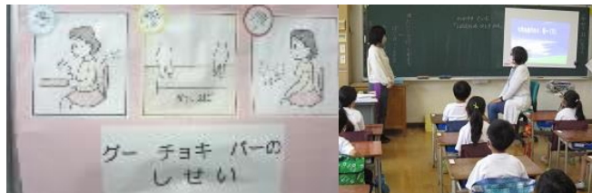
ソーシャルスキルトレーニング「かがやきタイム」

学習規律・生活規律の確立 特別支援教室の指導を活用したソーシャルスキルトレーニング 教師と児童、児童相互の信頼関係の構築 いじめを生まない心の育成 防災意識の向上 特別支援学級との連携によるノーマライゼーションの推進