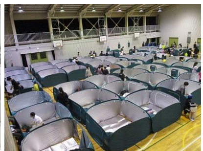
コロナ禍での宿泊体験