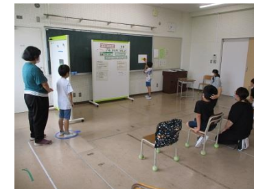
特別支援教室「わかば」