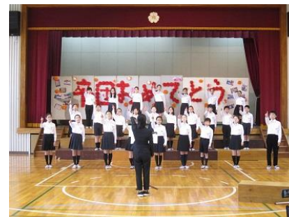
さくらコンサート