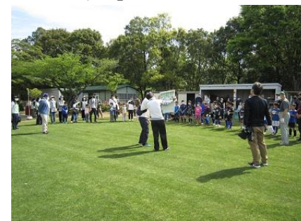
Gネットによる芝生管理作業