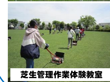
芝生管理作業体験教室