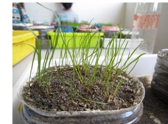
マイ芝生を育てる