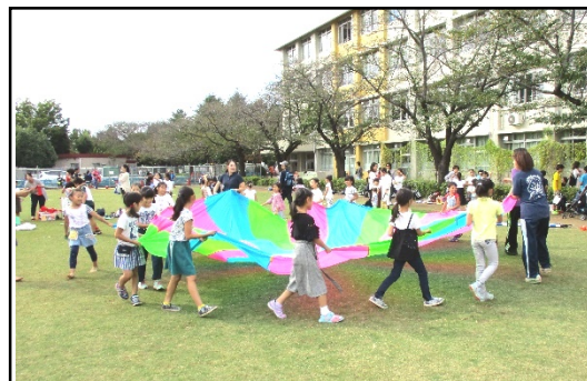
パラバルーンを楽しむ子どもたち

9月30日(土)の学校公開後、第9回エコスポ祭りが開催されました。今年も多くの団体の協力を賜り、キックターゲットやスピードガンコンテスト、フライングディスク、スナッグゴルフ、ローンボウルズ、二人三脚、車いす体験など、12もの出し物が展開されました。昨年、一昨年と、雨天のため、校庭での実施ができず、体育館でエコスポ祭りが行われていました。今年は大丈夫かなと、天気予報とにらめっこをする毎日でした。当日、さわやかな秋晴れの中、芝生の上でエコスポ祭りを実施することができ、安どの気持ちでいっぱいです。エコスポ祭りの良さは、芝生に親しむことだけでなく、学校と地域の方々、そして保護者の皆様が、子どもたちのことを思って、芝生の上に集まるところにあると思います。子どものためにそれぞれの団体ができることを考え、その結果、たくさんの子どもたちが笑顔になる、とてもいい機会だなと改めて実感しました。エコスポ祭りを通して、日頃の子どもたちの成長を共に見守り、育てていくという素晴らしい基盤の上で教育活動を行っていることに改めて気が付くことができたので、そのことを胸に、今後も子どもたちの成長を見守っていきたく強く思いました。今回ご協力してくださった団体の皆様に、心より感謝申し上げます。ありがとうございました。