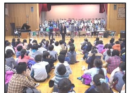
大松台小学校での練習 真剣に聞く4年生

最後に、今年も師走を迎えました。今年は大規模改修等でご迷惑を数多くお掛けしましたが、皆様方のご理解とご協力のおかげでこの一年を終えることができますことに感謝するとともに、皆様にとって新しい年がよい年になることをお祈りいたします。