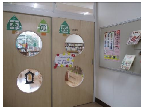
改修工事後の図書室

11/14～24の読書週間では、「全校によるおすすめの本を紹介する読書カードの掲示」、「2週間の朝読書」、そして「図書委員会による集会での発表」が行われました。「全校によるおすすめの本を紹介する読書カード」では、どのカードにも絵や文がとてもよく書かれていて、本の魅力がたくさん伝わってきました。廊下で足を止めて読書カードを見る子、6年生のカードを見て、感嘆の声を上げる子も見られました。また、「2週間の朝読書」では、朝学活の時間になると、学校中がしんととなり、一人ひとりが集中して本を読んでいます。「図書委員会による集会での発表」は、図書委員が全校児童に向けて読み聞かせを行いました。本のタイトルは「でんせつの きょだいあんまんを はこべ」。図書委員が用意した候補の中から、選ばれた本でした。オチがきいていて、多くの子どもたちが楽しんでいました。読書週間の様子からも、本校は読書が好きな子どもたちが本当に多いと感じます。日頃からのご家庭での読書環境、そして保護者の方による「読み聞かせ活動」のおかげです。読書をすることで、人は日常を出て、いろいろな世界を体験できます。今後も子どもたちがたくさんの本に出会い、読書がより身近なものになるよう指導し、サポートしていきたいと思えます。