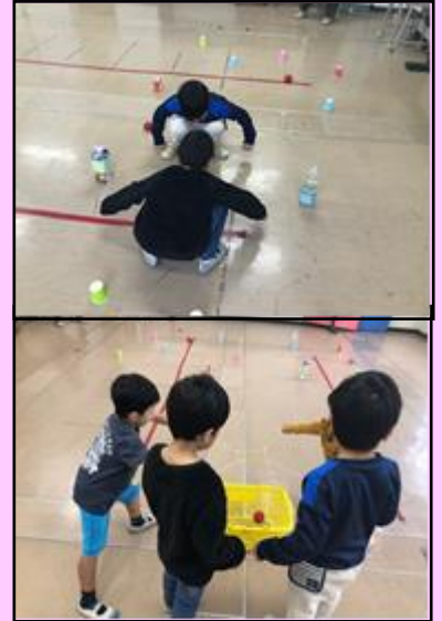
協力活動「ゴムゴムキャッチャー」の様子

十数年後、それぞれの子供たちが、わかばで学んだことを糧にして一人の自立した大人として生きていけるように、これからも温かく支え関わっていければと思っています。