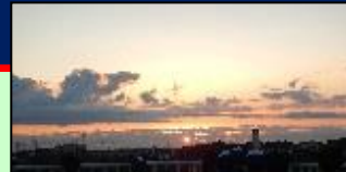
屋上で日出を見ました