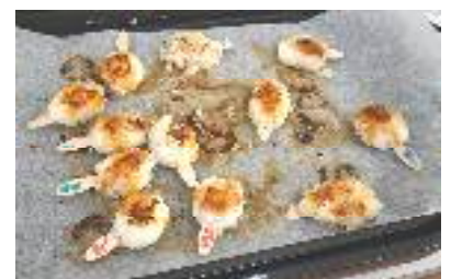
α米から作った五平餅

今夏は暑かった記憶が鮮明ですが、これも温暖化による気候変動の一つの現象であると考えられています。来年度以降も、「暑い」「寒い」「台風」「大雪」等の極端な気候が生じることが予想されます。違う世界の話ではなく、例えば夏季の水泳指導など、学校現場でも考慮が必要な状況となっているのです。眼前の子供たちには、そんな未来をいかにして乗り切っていくかという能力が求められています。本校でも、主体性をもって考え、行動することができるよう、「総合的な学習の時間」のカリキュラムを再考している最中です。展覧会の学校公開に併せて、「南極教室」や「ヤクルトの食育授業」「α米から五平餅を」といった出前授業を開催したのは、まさに今できることの一環です。保護者の皆様には、ちょうど「学校外部評価」をお願いしているところです。ご意見を伺いながら、子供たちが展覧会で見せてくれた創造力をより身に付けるために、次年度の教育計画を立案していきます。今後とも、ご理解・ご協力をよろしくお願いいたします。