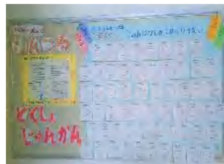
↑ 図書委員会企画 (図書室前の掲示) 「一日だけこのお話のこれになりたい」

読書をすることで、人は日常を出て、様々な世界を見たり、体験したりすることができます。そんな読書の楽しさを子供たちがたくさん感じられるように、今後も指導し、サポートしていきたいと思えます。