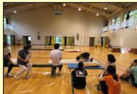
夏季休業中に実施したマット運動の研修

また、毎学期『授業実践交流週間』を設けて教員相互の授業参観を実施しています。参観することによって、よい点を自分の授業に生かしたり、授業について議論することによってよりよい授業づくりに役立てたりしています。個々の教員が生き生きと活躍し、OJTを通して学んだことが一つでも多く子供たちの学校生活に生かせるようにしています。これからも、一人一人の子供が輝けるような学校づくりを目指していきます。